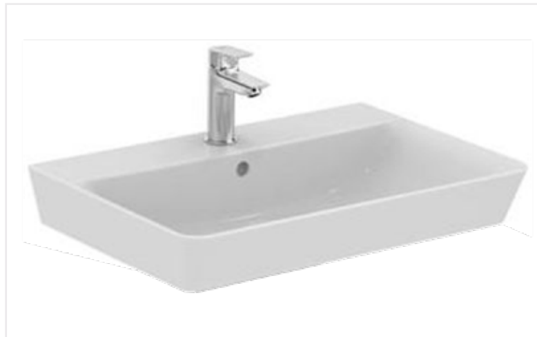
02 Umyvadlo Concept Cube 2.0