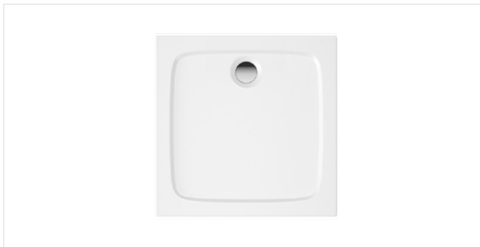
- - 03 Sprchová vanička EASY – 90 x 90 cm