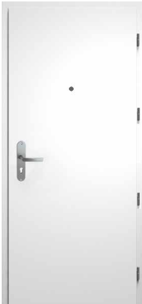
02 Pohled vnitřní