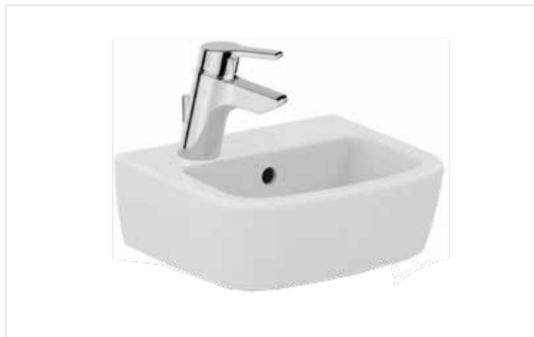
04 Umývatko Tempo