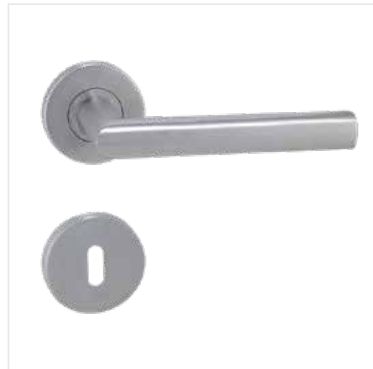
03 MP Favorit