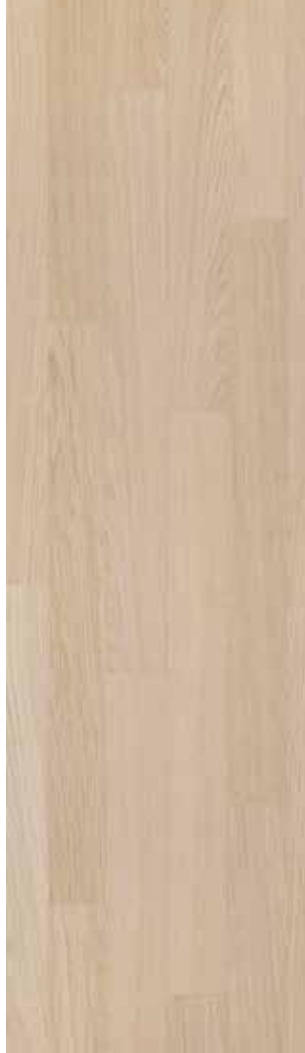
02 Milk Oak