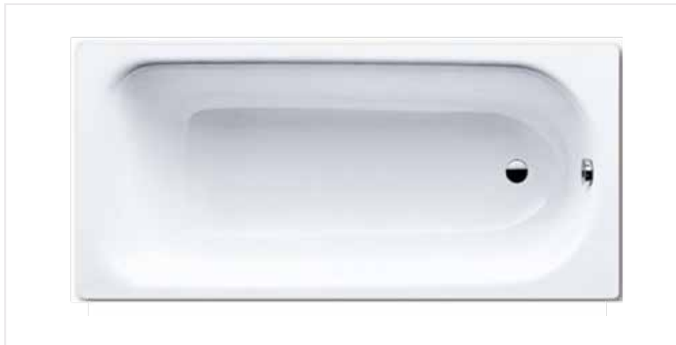
02 Vana Saniform plus – 170 x 75 cm