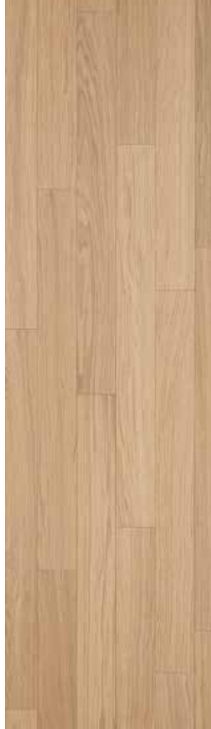
03 Ivory Oak