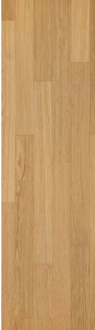
01 European Oak