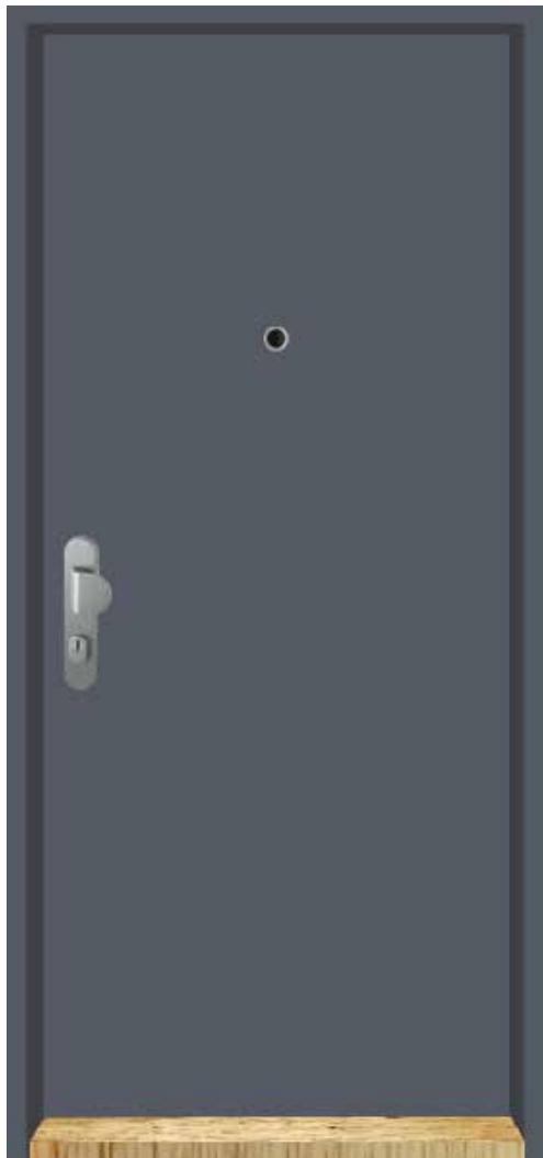
01 Pohled vnější