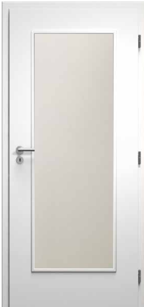
02 Lignis - Linie - Lux 33