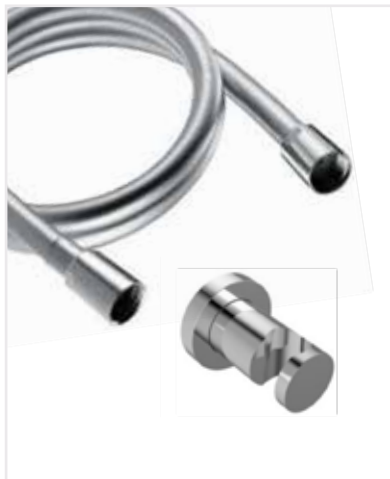
01 Sprchová hadice, držák na sprchu