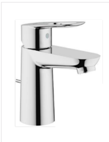
05 Umyvadlová baterie BauLoop