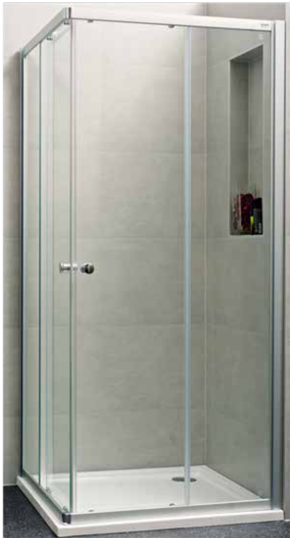
01 Sprchový kout 90 x 90 cm