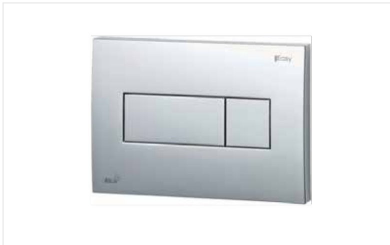
01 Tlačítko Easy