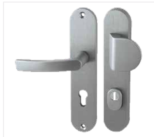
04 Kování vstupních dveří