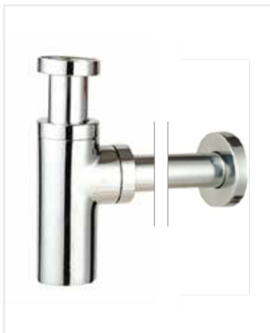
04 Sifon Design