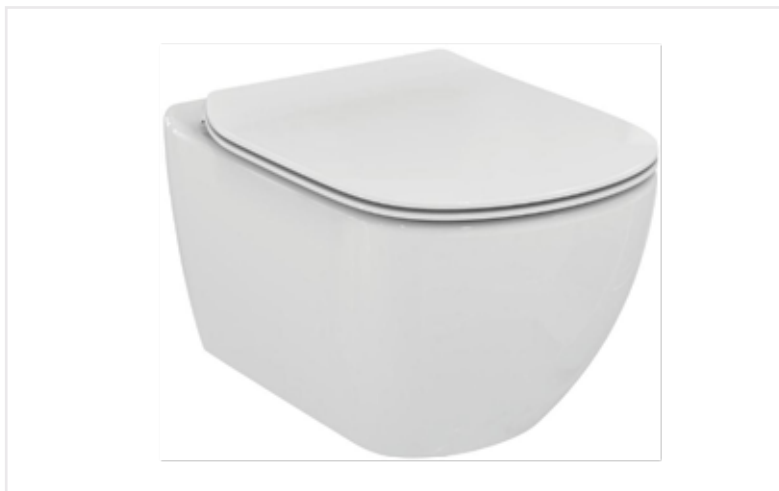
03 Závěsný záchod Tesi