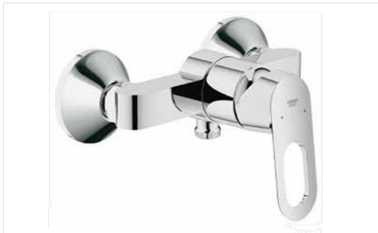
03 Sprchová baterie BauLoop