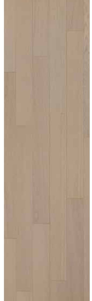
05 Desert Oak