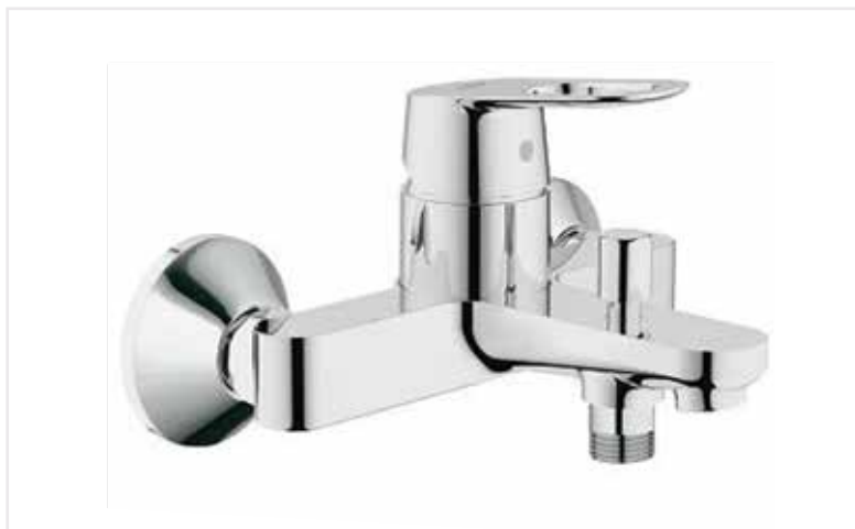
06 Vanová baterie BauLoop