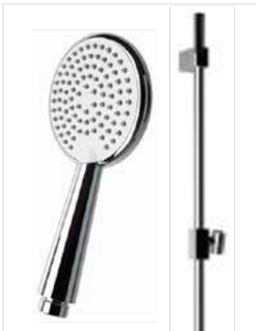
02 Ruční sprcha 1 polohová, kulatá sprchová tyč