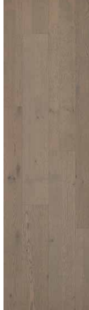
04 Manhattan Oak