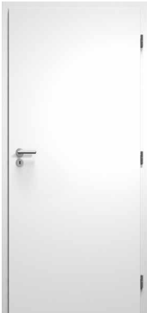
01 Lignis - Linie